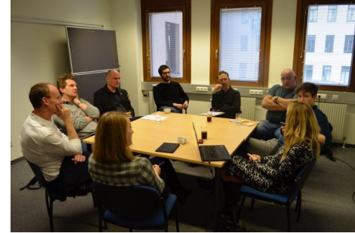
Arbeitsgruppe beim Plattformtreffen 2017