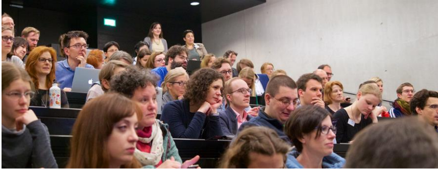
Österreichische Citizen Science Konferenz 2018