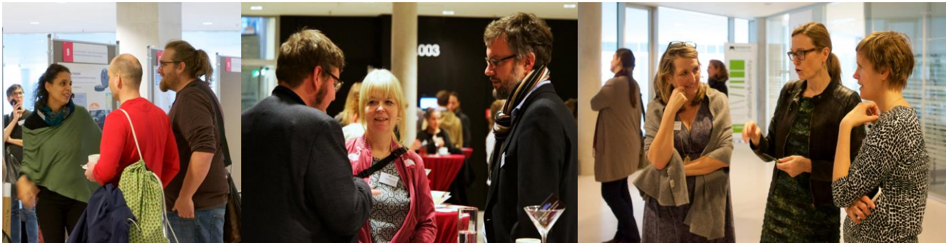
Österreichische Citizen Science Konferenz 2018